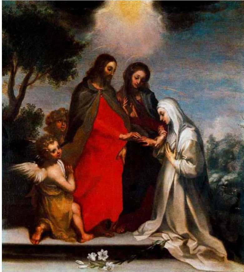
Francesco Vanni, Matrimonio mistico di S. Caterina da Siena, XVI sec., Gall. Palatina, Palazzo Pitti, Firenze