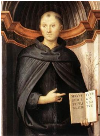
San Nicola da Tolentino

“Cara Madre, dopo questo accenno Ella può pensare mille altre cose, tutto ciò che vuole ... perché tutti i doni sono in questa piccolissima, semplicissima creatura. E per sovrabbondanza e squisitezza di doni essa si stacca da tutti gli altri campioni che finora ci ha presentato Santa Chiesa. Se mai a me fa pensare al nostro S. Nicola da Tolentino, e mi danno ragione. Da ciò Ella arguisce che non si tratta della “piccola via” di una seguace di Santa Teresina. No: altro spirito. Senta, è Gesù stesso (che dice) “E’ una via nuova: arrivare alla più eccelsa grandezza mediante la più grande semplicità. Perché hai conosciuto il tuo nulla. Sei la mammoletta nascosta, ma poi tutti ti conosceranno (qui lei protesta, chè non vorrebbe neppure dopo); tutte le Anime, in qualunque stato, avranno un campione da imitare e sarà gloria di tutto l’Ordine” .