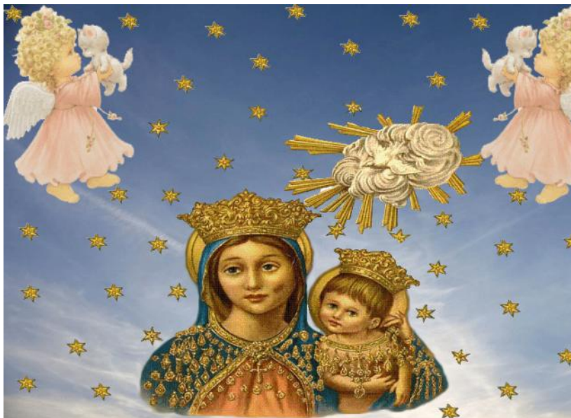
Immagine di Madonna con Bambino Venerata nel Santuario della Madonna dell’Arco (NA)

Proprio nelle mani della Madonna consegnò il suo turbamento per quelle mani e quei piedi che sanguinavano, in quel fatidico 14 settembre 1935.