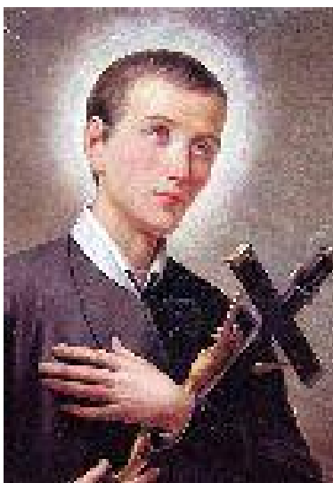
San Gerardo Maiella